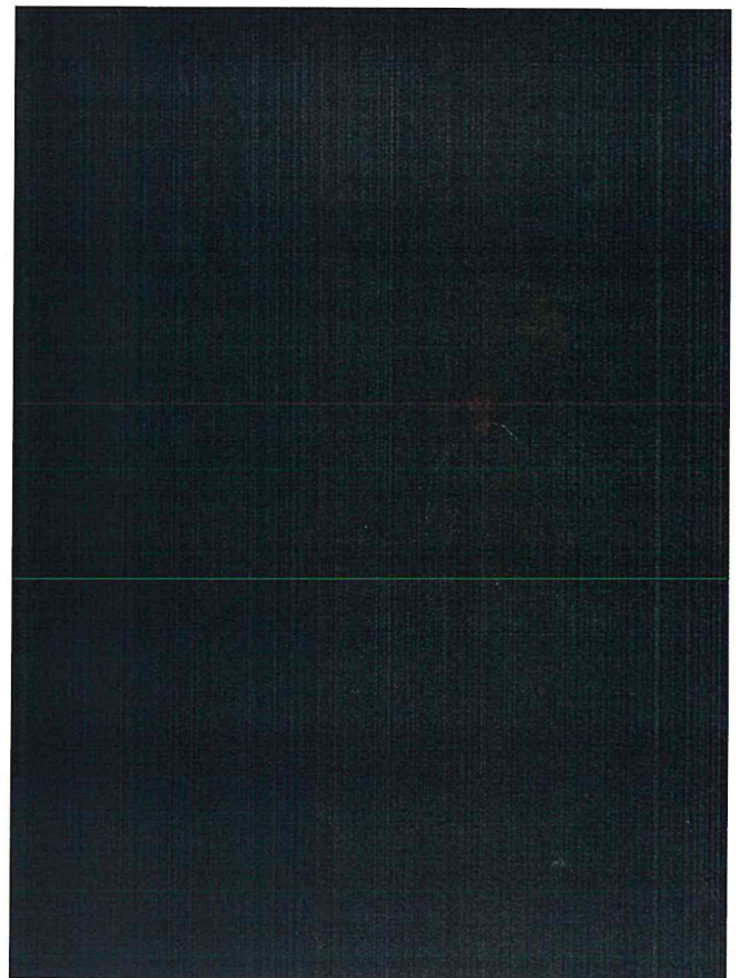
Foto: Via pública sem iluminação – inteiramente ligada à sensação de abandono e insegurança.